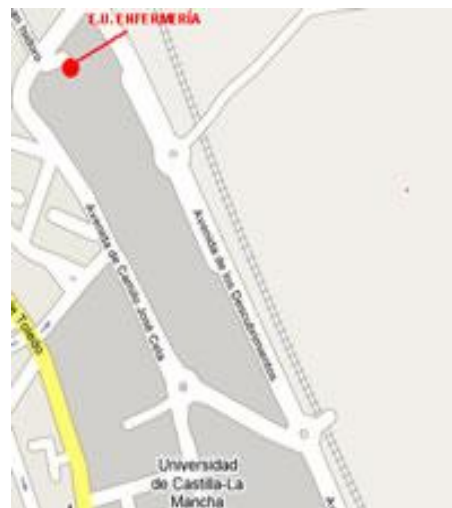
Mapa de situación en el Campus.