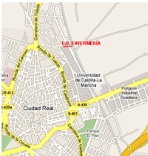
Mapa de Situación en Ciudad Real