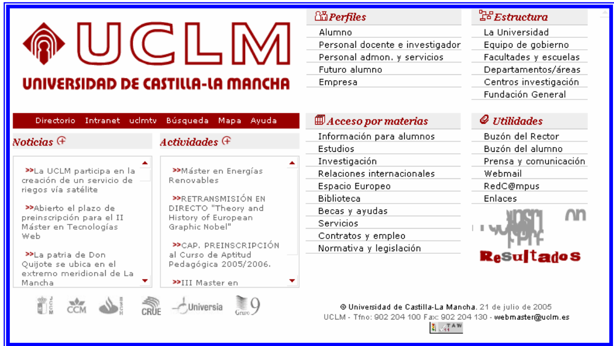
Página principal de la web de la UCLM

En la página web de la UCLM ( www.uclm.es ) se encuentra toda la información necesaria para la formación e información de los alumnos matriculados en nuestra Universidad.